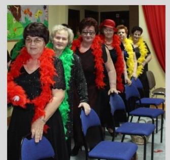
DZIEŃ KOBIET w Węsjorach i Męciszewicach