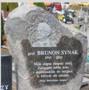
Wspomnienie o Brunonie Synaku ...